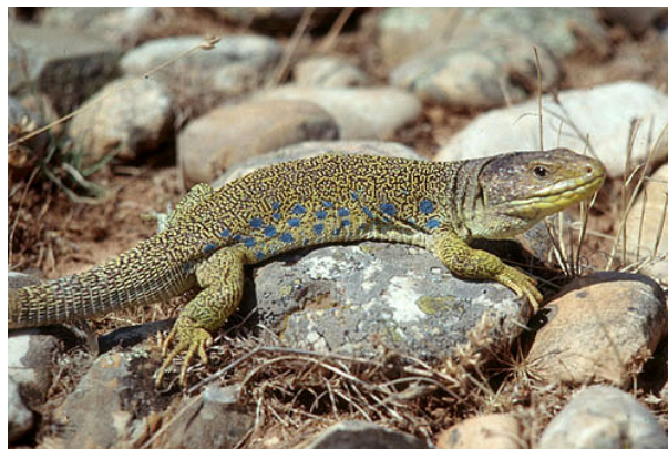
Figura 1. Hembra adulta procedente de San Martin de Crau (Bouches du Rhône, Francia), con el dorso en el que se mezclan escamas negras y amarillas formando un dibujo poco definido y con el cuello pardo; estas características son frecuentes en individuos de la subespecie nominal ( Lacerta lepida lepida ).

- Lacerta lepida oteroi , Castroviejo y Mateo, 1998 (Isla de Sávora, Galicia). Etimología: taxón dedicado a D. Manuel Otero, Marqués de Revilla y antiguo propietario de la isla de Sávora; Terra typica : Isla de Salvora (La Coruña - España).