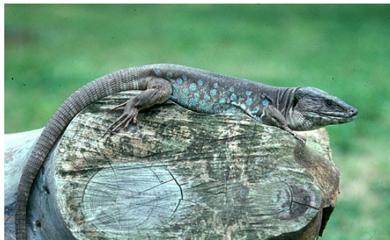
Figura 3. Macho adulto procedente del Cabo de Gata (Almería); el dibujo del dorso, carente por completo de escamas negras, es el característico de la subespecie Lacerta lepida nevadensis .

Se consideran sinónimos de esta variedad los taxones Lacerta ocellata hispanica de López Seoane (ver Mateo, 1988), y Lacerta lepida galaica de Mateo (1988).