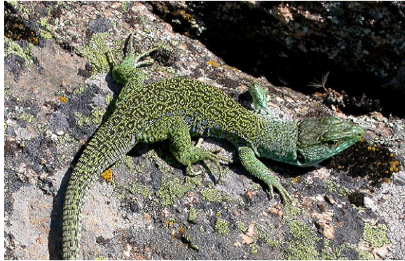
Lagarto ocelado. Ejemplar de Navacerrada (Madrid).