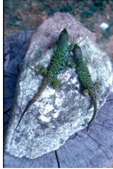
Figura 2. Ejemplares de la subespecie Lacerta lepida iberica procedentes de la isla San Martiño de Cíes (Pontevedra); derecha: macho subadulto, izquierda: hembra adulta.

Lacerta lepida iberica , López Seoane, 1884. La primera variedad asociada a una región concreta fue Lacerta ocellata iberica , descrita por López Seoane (1884) para poner de manifiesto las supuestas diferencias existentes entre lagartos ocelados españoles y franceses. En realidad, este autor gallego basó casi exclusivamente su descripción en individuos capturados alrededor de su casa, en la localidad coruñesa de Cabañas, por lo que la población con características diferenciadas era en realidad la del litoral gallego. Así lo entendió Buchholz (1963) que restringió la Terra Typica de la variedad a la localidad de A Coruña.